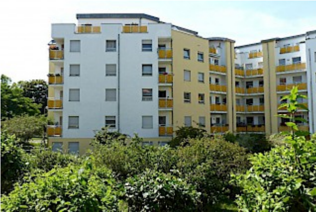
Blick zur Wohnung