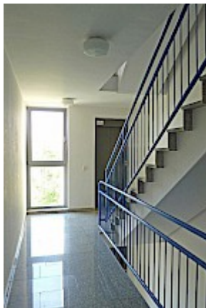
Treppenhaus mit Aufzug