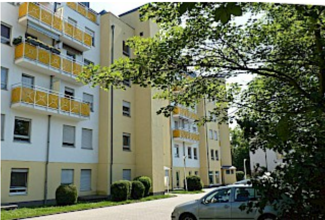
Blick zum Haus